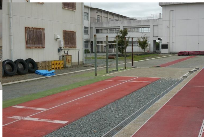
走高跳専用練習場所（オールウェザーシート助走路・専用マット）