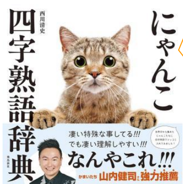
「にゃんこ四字熟語辞典」 西川清史著、飛鳥新社、2022

母親との確執を描いたコミックエッセイ『母がしんどい』の著者が、親との関係に悩んでいる中高生に向けて書いた本です。すべてマンガで読みやすいですよ。