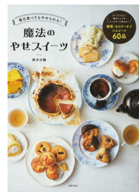
「魔法のやせスイーツ」 鈴木沙織著、主婦の友社、2022

糖質・カロリーオフのスイーツレシピが紹介されています。ダイエット料理研究家による健康志向のスイーツを作ってみませんか？