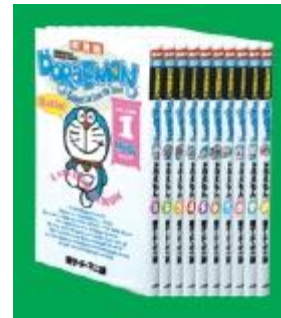
「愛蔵版 Doraemon vol.1~6」藤子・F・不二雄著、小学館、2006

英語と日本語、どちらからでも読むことができる、漫画『ドラえもん』をテーマごとに編集したシリーズ。①感動する話 ②爆笑する話など、気分にあわせて読んでみてください。